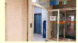
業務用エレベーター